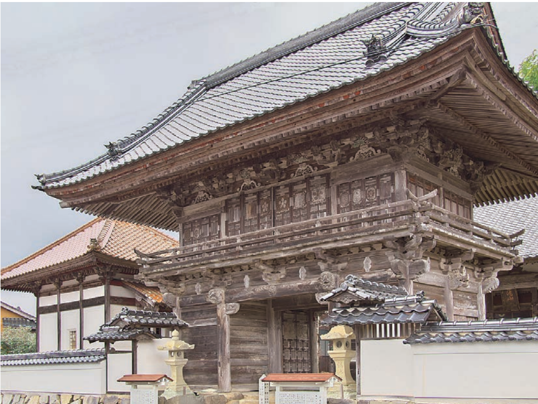
寺院名物シリーズ㊦ 川本組正蓮寺山門 (呂智郡川本町南佐木)

建立は寛延 4 年 (1751 年) と推察されます。三原地域は、たたら製鉄や米所として栄えました。この総樺づくりの楼門は驕ることなく仏法を大切にされた方々の篤信を感じます。