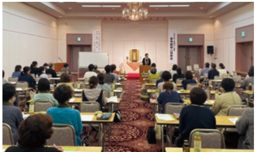
若寺族婦人研修会のようす