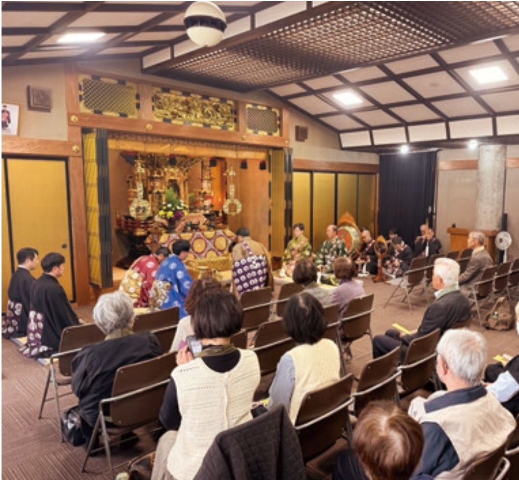
本願寺山陰教堂本堂