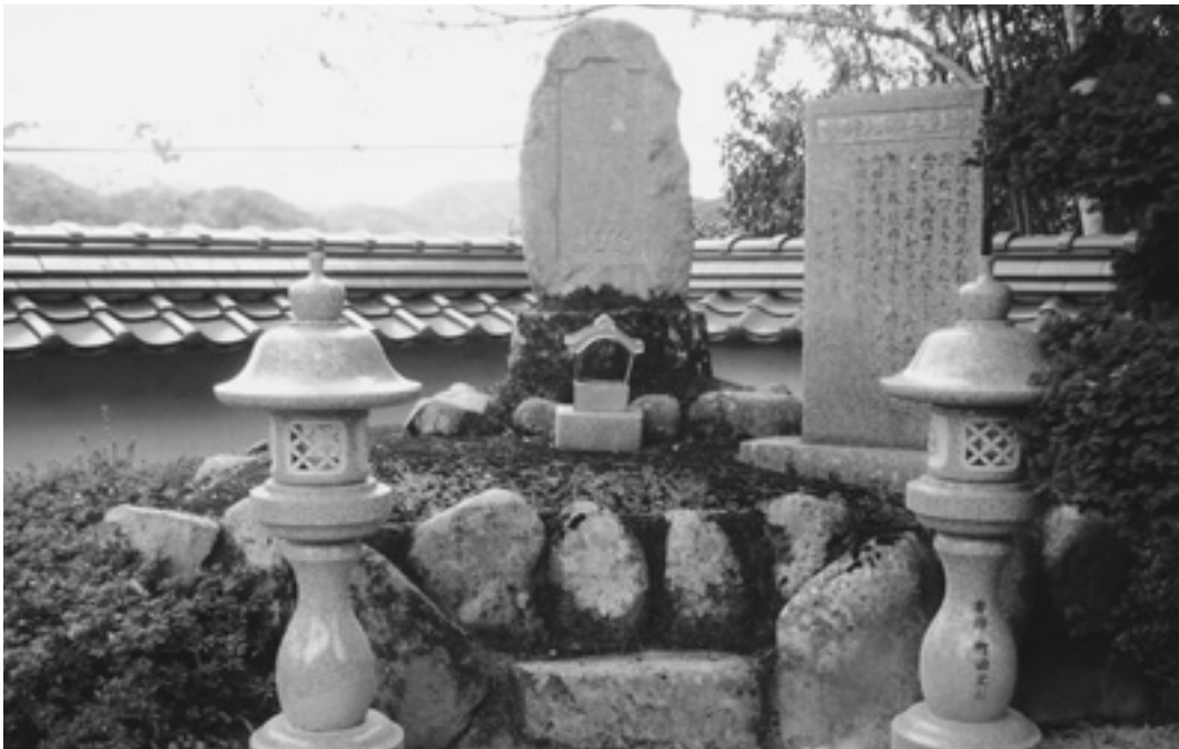
寺院名物シリーズ⑨ 邑智東組・眞清寺

磯七同行顕彰碑：『妙好人伝』に紹介された磯七同行は当寺の門徒であり、今もその子孫がおられる。宝暦年間に生まれ嘉永4 (1851) 年に90歳で往生された。その生涯は伝記にみられるとおり篤信な念佛者であり、有福の善太郎同行と親交があったようだ。眞清寺第11世順命は識徳備わった学僧で、磯七同行とは同時代の人であり、少なからぬ交流があったと思われるが、明治の本堂落雷大火により、それを窺う資料等が焼失している。